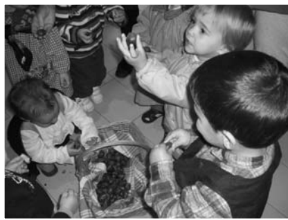
Llar d'infants PUIGVENTÓS