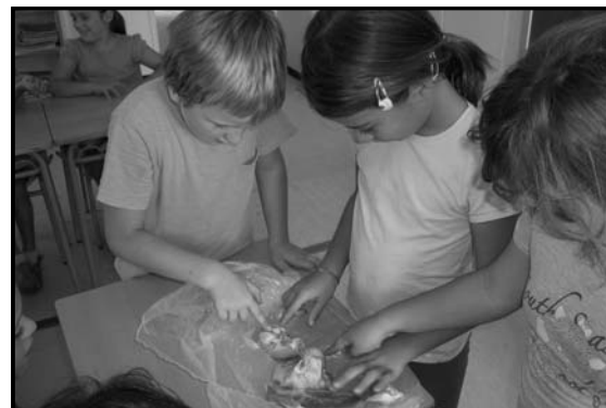
També observar ossos reals ens ha servit per veure les articulacions.