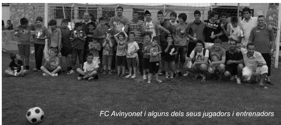
FC Avinyonet i alguns dels seus jugadors i entrenadors

Aprofitem l'avinencesa per desitjar-vos BON NADAL i BONES FESTES!