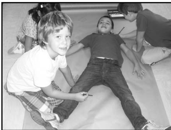
Hem dibuixat les nostres siluetes a mida real.