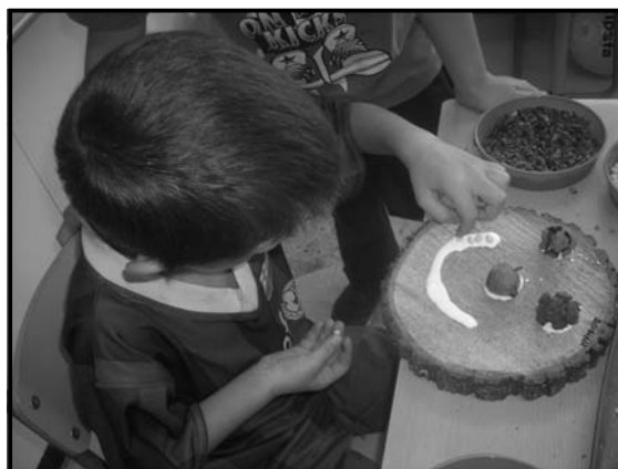
Hem representat les parts de la cara utilitzant elements de la natura.